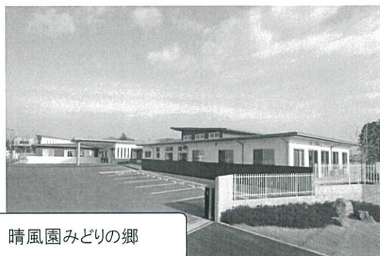
晴風園みどりの郷