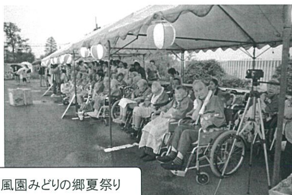
晴風園みどりの郷夏祭り