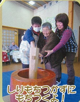
しりもちつかずにもろつくよ！