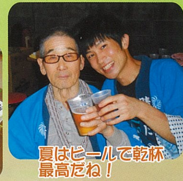
夏はビールで乾杯最高だね！