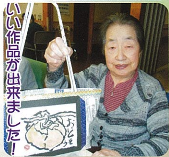
いい作品が出来ました！