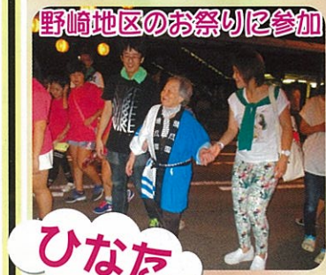
野崎地区のお祭りに参加