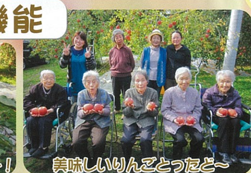
美味しいりんごとったぞ～