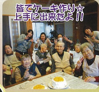
皆でケーキ作り☆上手に出来たよ！！