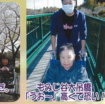
もみじ谷大吊橋「うお～」高くて恐い！