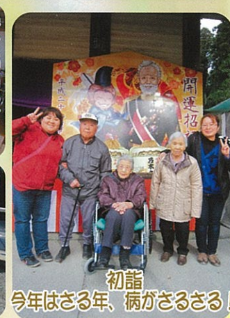
初詣 今年はさる年、病がさるさる！