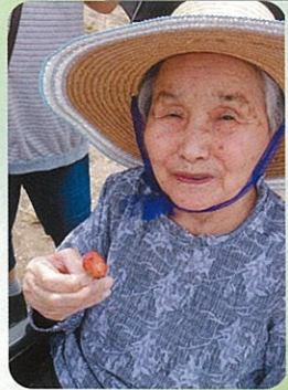
甘くて美味しいよ