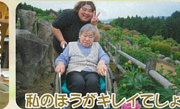
私のほうがキレイでしょ