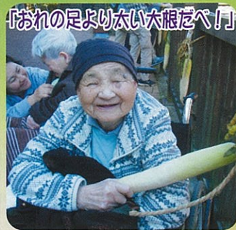
「おれの足より太い大根をべ！」