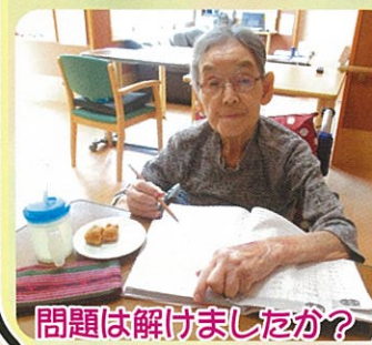
問題は解けましたか？