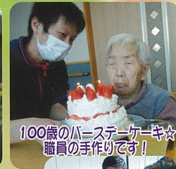
100歳のハースターケーキ☆職員の手作りです！