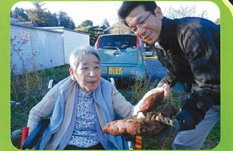
サツマイモ採ったぞー！