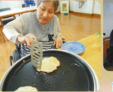
美味しそうに焼きあげました♪