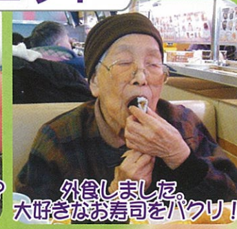
外食しました。大好きなお寿司をバクリ！