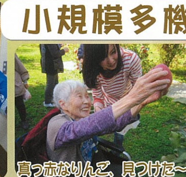
真っ赤なりんご、見つけた～！