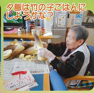
夕飯は竹の子ごはんにしようかな？