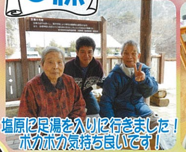
塩原足湯を入りを行きました！ホクホク気持ち良いです！