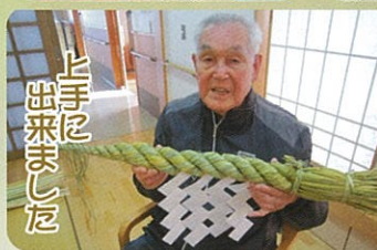
上手に出来ました