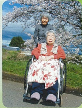
満開！とってもきれい