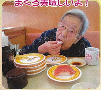
まぐる美味しいよ！