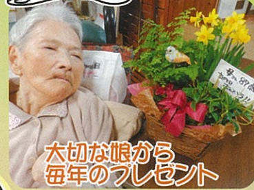
大切な眼から毎年のおプレゼント