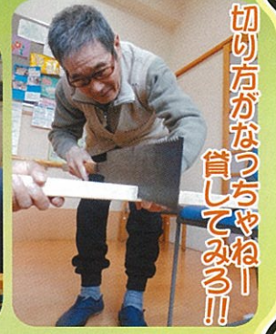
切り方がなつちやねー！首してみる！！