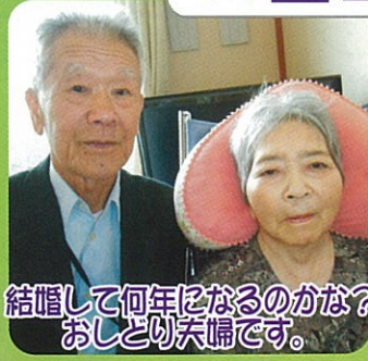
結婚して何年になるのかな？おひとり夫婦です。