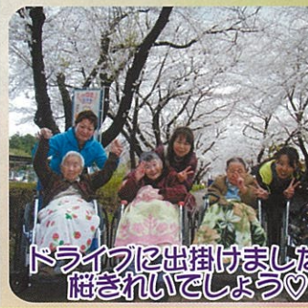
ドライブに出掛けました。桜きれいでしょう♡