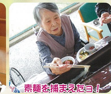
素麺を捕まえたヨ！