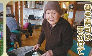
巻き寿司はまかせて