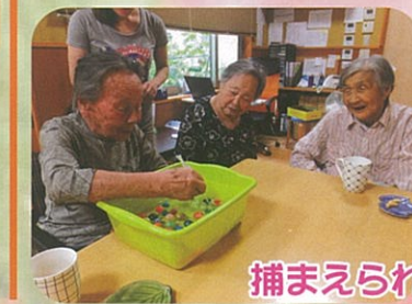
捕まえられるかな?