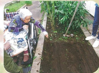
大根の種まき大きくなーれ!!