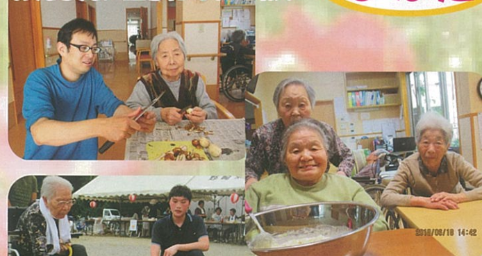
お好み焼き会 みんなで生地から作りました