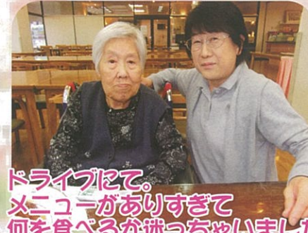
ドライブにて。メニューがありすぎて何を食べるか迷っちゃいました。美味しく全て頂きました!!