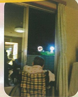
佐久山の花火鑑賞☆