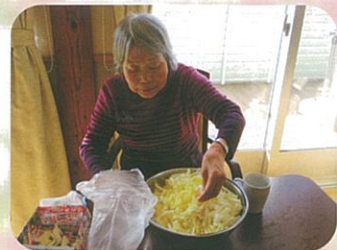
白菜の漬物を作りました。