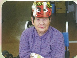
鬼は〜外。豆まきを行いました。