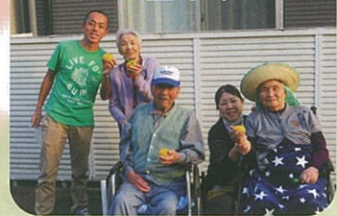
もぎたての柚子はいい香り♡