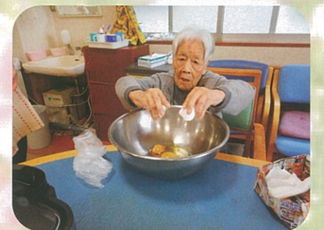
調理実習にて、卵割れたよ!!