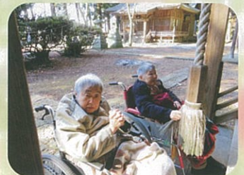
初詣に行ってきました♪