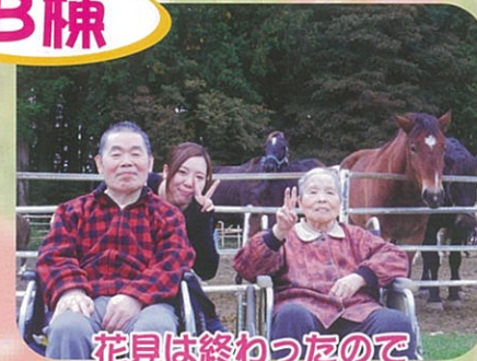
花見は終わったので馬さんを見に来たよ!