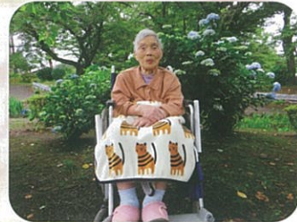
奇麗でしょアジサイと私♡