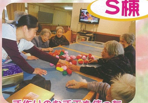
手作りのお手玉を使ったレクリエーション