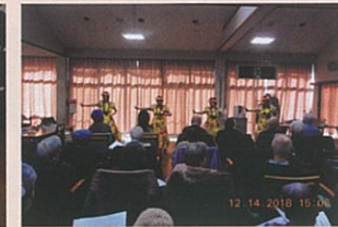
ボランティア訪問