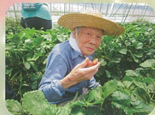
暑い中頑張りました(^^)