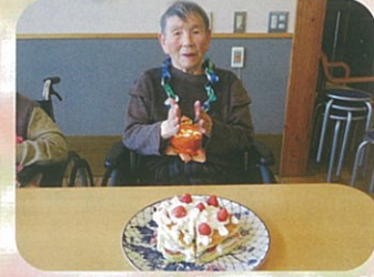
89歳のお誕生日拍手