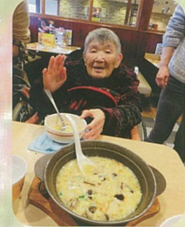
外出に出かけました。