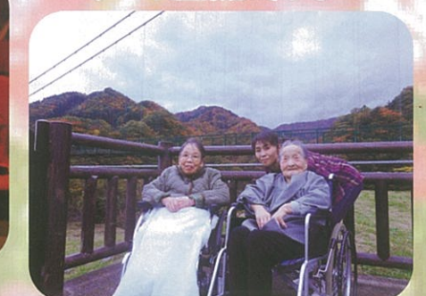
今年の紅葉は寒いよ〜