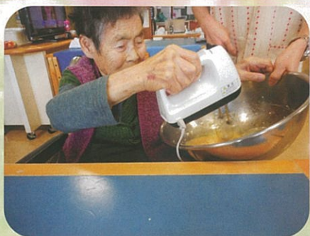
割った卵は私がまぜるよ!!