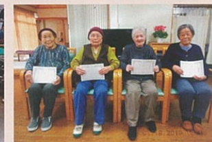
レクリエーション表彰式