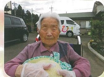
今から種まき開始