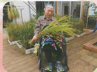
初めてのこめつくり豊作豊作!!