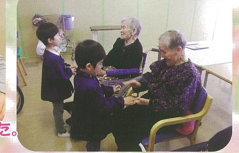
子供達の小さな手とふれ合い、笑顔と元気をもらいました。