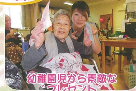
幼稚園児から素敵なプレゼントをたくさんもらいました。