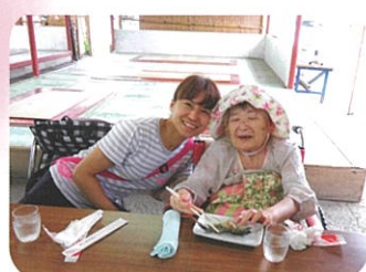
鮎を食べに行きました