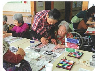
うまく描けるかな?