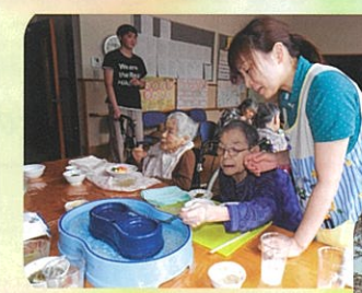
上手にすくえます