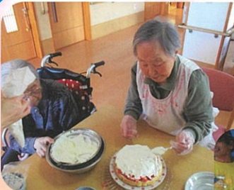
誕生日の ケーキ作りです