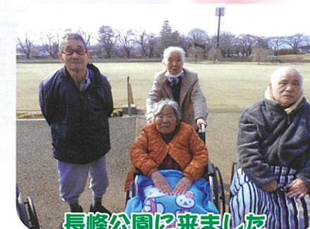
長峰公園に来ました