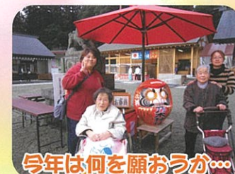
今年は何を願おうか...