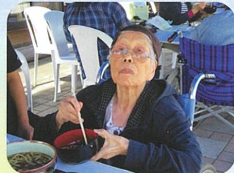
美味しくて...うまい♪