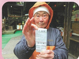
良い年になりそう☆