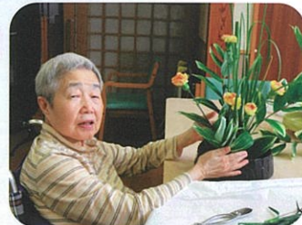
私のお花きれいでしょ?