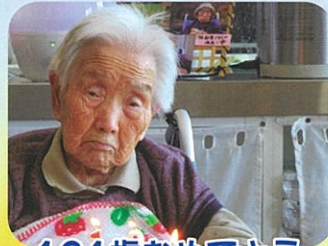
101歳おめでとう ございます♡♡♡