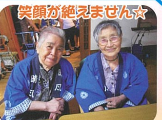
笑顔が絶えません☆