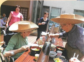
大好きな魚釣りに 出かけました