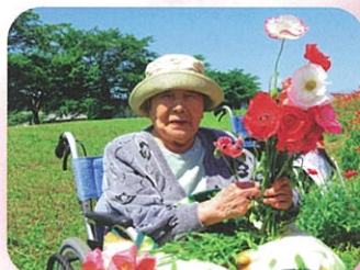
綺麗でしょ♡ ホビーと私♡