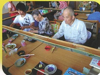
流しそうめんでしょ(^o^)/