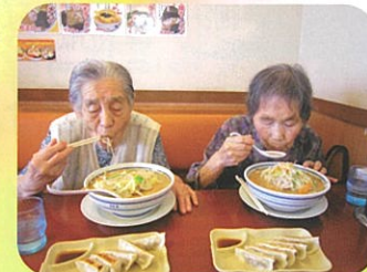
念願のラーメン & 餃子セット