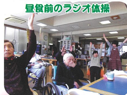
昼食前のラジオ体操