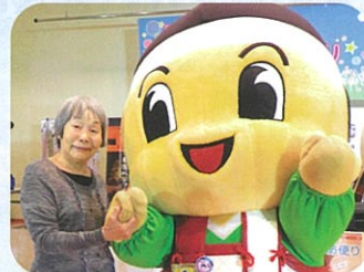
与一ちゃんとハイポーズ!