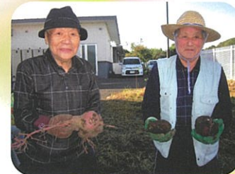
大きくて いいあんばいだ!