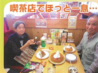
喫茶店でほっと一息...