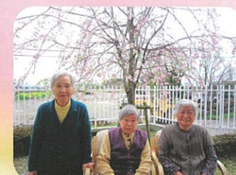
しだれ桜満開! 笑顔も満開!