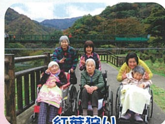
紅葉狩り、 みんなでピース☆