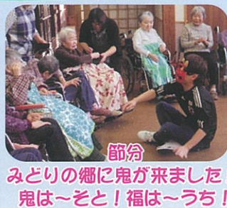
節分 みどりの郷に鬼が来ました!! 鬼は～そと! 福は～うち!