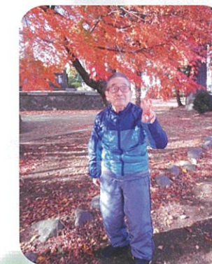
紅葉の下でハイチーズ! 散歩が一番だね!