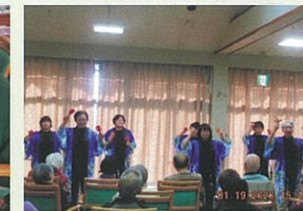
ボランティア訪問