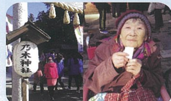
乃木神社へ参拝に行きました。 おみくじを引き、結果は 大吉でした(*^-^*)