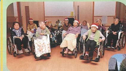
クリスマス会♪全員集合!!