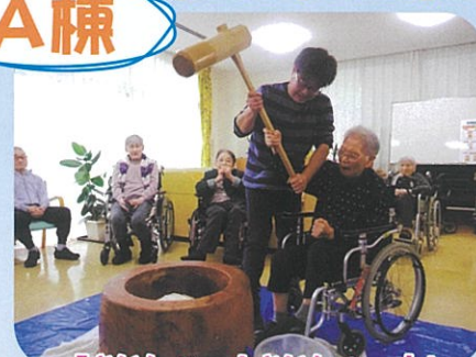
「よいしょー!よいしょー!」 美味しいお餅ができるかな?