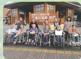
足湯に浸がり 体ポカポカ