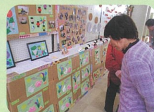
親園文化祭に 行ってきました