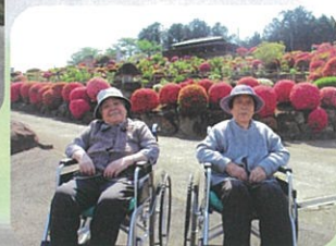
ほたん園にて 行けてよかったー!!