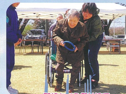
野崎さくら祭りにて 輪投げに挑戦!!!