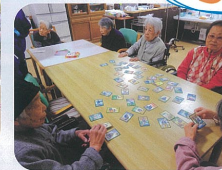
かるた取りゲーム 誰が優勝できるかな?