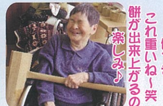
餅つき これ重いね、笑 餅が出来上がるの 楽しみ♪