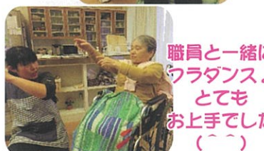
職員と一緒に ワラダンス♪ とても お上手でした (^-^)