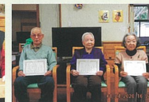
レクリエーション表彰式