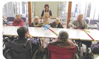
体を動かして、気持ちいい