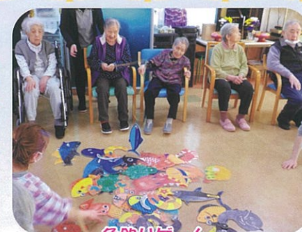
魚釣りゲーム 大物ねらって頑張ります!