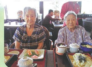
お寿司とうどんで お腹一杯