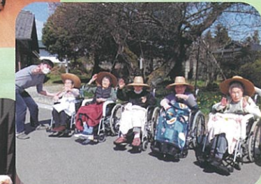
晴風園の梅の花も きれいだよ〜!