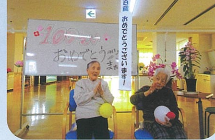
祝!100歳のお誕生日会! お二人ともおめでとございます♪