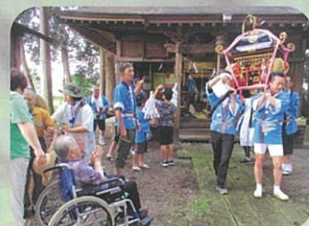
大杉神社 南区の祭りにて