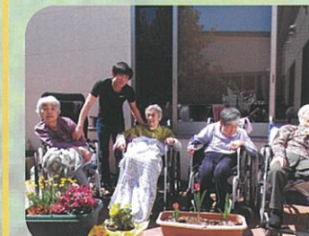
天気の良いので 中庭で日向ぼっこ