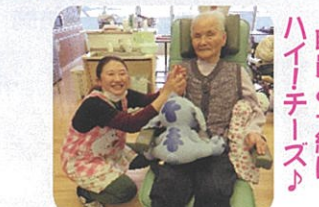
職員と一緒に ハイチーズ♪