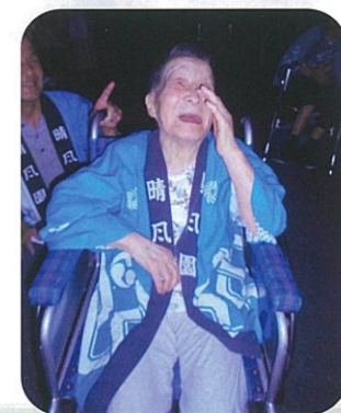
「たまや〜」 花火きれいだねえ!