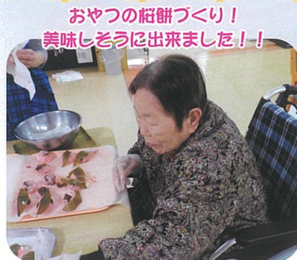
おやつのお餅づくり! 美味しそうに出来ました!!