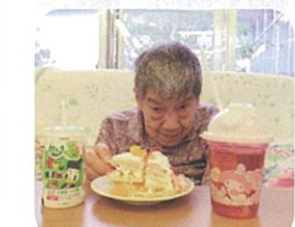
皆さんで、 ケーキ作りをしました♪ とてもおいしそう (#^-^#)