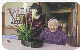
花より、わ・た・し