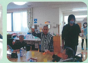
ほのか棟忘年会 「乾杯～ビール美味しい～!!」

旅行・病気・冠婚葬祭・介護疲れなど、お困りの時にはご相談下さい。気持ち良くお泊まりして頂けるようスタッフ一同、精一杯お世話させていただきます。