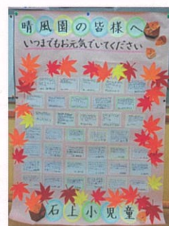
石上小学校からのお手紙

ご協力ありがとうございました。 新型コロナが収束したら、また皆様をお待ちしております。