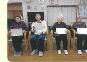
元気はつらつ活動表彰式