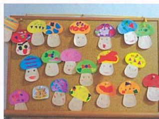
西那須野幼稚園から折り紙