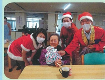
メリークリスマス☆ サンタさんがきました