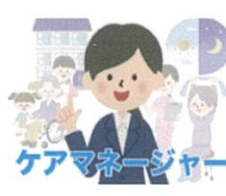
ケアマネージャー

介護相談から始まり、高齢者やご家族に代わり申請書類の作成や認定調査を受ける手配を行うことでスムーズに手続きができます。