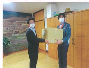
キヤノンメディカルシステムズさんによる屋外作業(窓拭きや屋外の落葉さらいなど)とタオル寄贈_(._)_