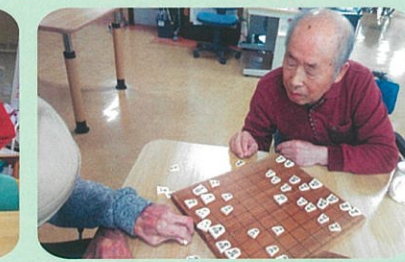
ベテランの指し手! 真剣な表情や笑顔がみられます☆