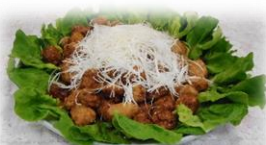
肉団子 甘酢あんかけ