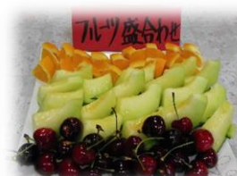
フルーツ盛り合わせ

6月10日(金)に昼食バイキングを行いました。今回は、「梅雨の時期でも元気に過ごしていただきたい」をテーマに、様々な料理がテーブルに並びました。