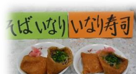
そばいなり いなり寿司