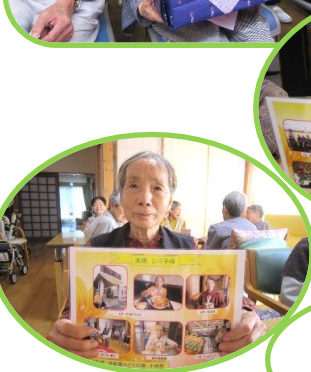
記念品&プレゼント贈呈