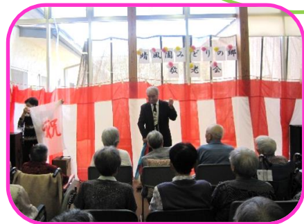
きらく&きらら様によるマジック&ハーモニカ演奏