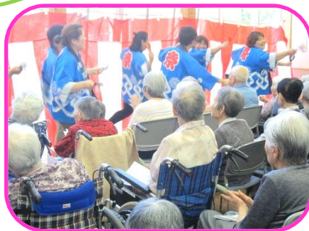
職員による余興(よさこい)