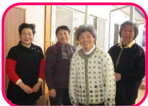
薄葉 ほほえみセンター様