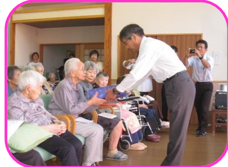
きさらぎ会の皆様による大正琴